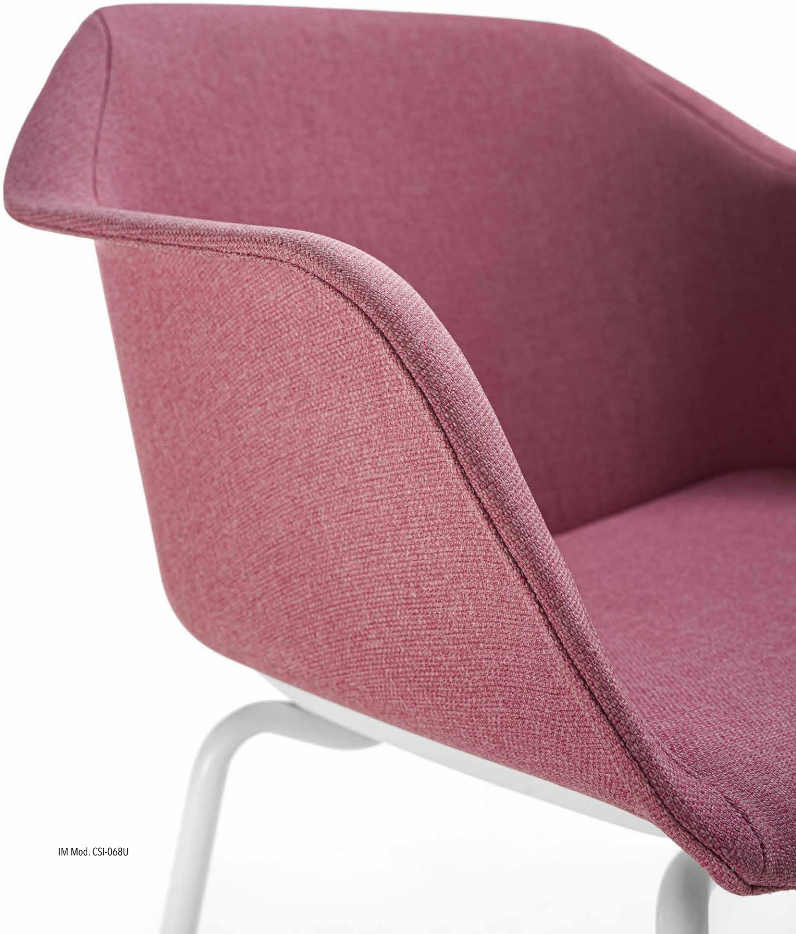
IM Mod. CSI-068U