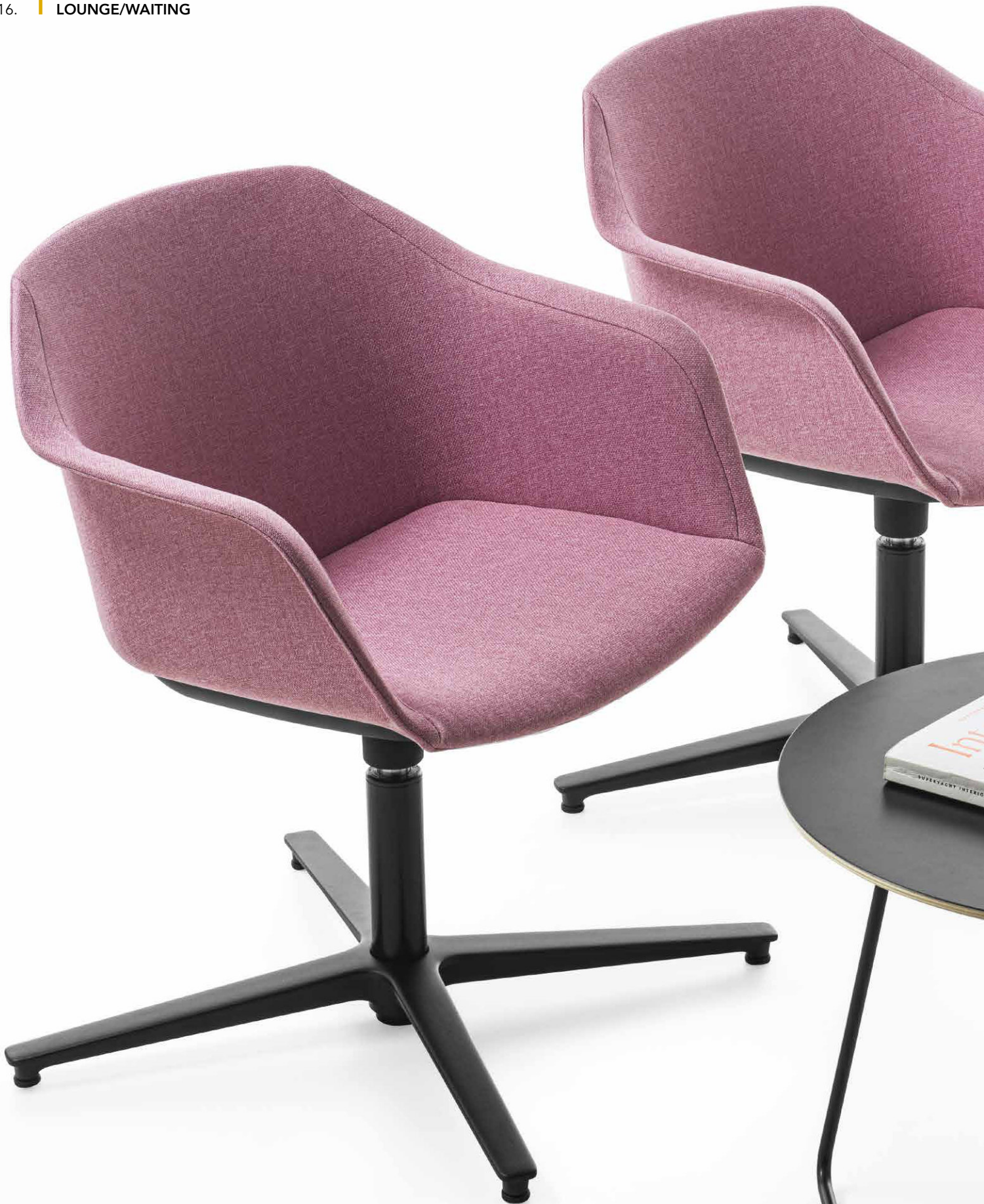
IM Mod. CSI-098U