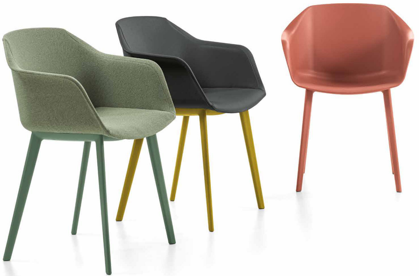
IM Mod. CSI-056U